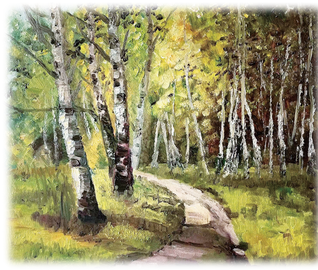
秋意 杨晓芳 作

合上相册，爷爷轻轻抚摸着封面，许久没有说话，仿佛还沉浸在回忆中。我突然明白了爷爷为什么把这本相册当宝贝，因为它承载着时代的变迁和我们国家翻天覆地的变化。爷爷常说，做人不能忘本，现在的生活来之不易，要倍加珍惜。我是多么幸运能生长在新时代！我一定要努力学习，将来把伟大的祖国建设得更加富强！