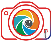
山西中部城市群党报摄影工作者联盟