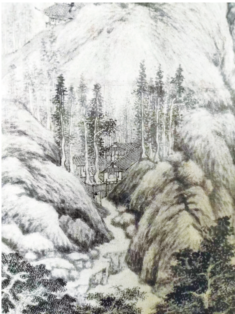
《匡山秋霁图》(局部) 明·沈周 纸本，水墨 纵211.4厘米 横110厘米 上海博物馆藏

值得一提的是，沈周在创作此画时，已经79岁高龄，但他的笔法依然苍劲有力，丝毫不减当年。