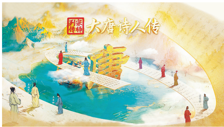
《宗师列传·大唐诗人传》