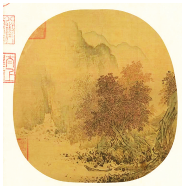
《秋山红树图》宋·萧照 绢本设色 纵28厘米 横28厘米 辽宁省博物馆藏