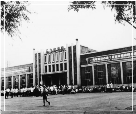
上世纪50年代太原火车站

孙中山要来太原了。 人们奔走相告，从火车站到现在的五一广场，涌满了人，正太路上张灯结彩，学生手执彩旗喊口号，乐队使劲奏乐，热情一浪高过一浪，一直持续到孙中山走下专列，脱帽向群众致意。几声欢迎的礼炮响过，群众高呼声不断，这样的热烈持续了很长时间，一直到孙中山入了城，下榻在皇华馆都没有停歇。 孙中山是来考察正太铁路及山西矿产情况的，那天是1912年9月18日。与官方人士会谈，在山西大学堂演讲，会见同盟会、军界、实业界及各党派人士，忙碌了三天，21日他离开了太原，送行的人群更多，纷纷挤到火车站和他道别。 太原近代史上，孙中山这一次来是大事，为太原工商业发展奠定了基础，而他到来和离开的火车站也定格在历史里。 之前的太原，作为辛亥革命的呼应，也响起了起义的枪声，很快太原光复，孙中山还给了太原起义很高的评价：“使非山西起义，断绝南北交通，天下事未可知也。” 之前的清光绪三十年（1904），光绪批准了建设正太铁路，1907年正太线正式通车，这时的太原车站，人们称为太原府站，因为太原是清王朝的府城。 孙中山来时，太原府站是巴洛克式建筑，与石家庄火车站一模一样的奇怪建筑，我们无法说清楚它的形状，如果你知道这条铁路是由法国工程师越黎勘探，法国总工程师埃土巴尼主持施工，后由法国经营，一直到1933年才移交民国政府，就不会奇怪了。 在17世纪的法国，英国人休·昂纳在《中国风》中写道，当时兴起了巴洛克式中国风，他们把东方和欧洲元素结合起来，形成他们的世界，包括商品，也包括建筑，这股风一直持续到18世纪，他们意识里的东方，是那样富丽堂皇，所以建筑上要打破平衡，追求意外。平面图上看是椭圆形、橄榄形或复杂的几何图形的建筑，或许满足了他们的心理期待，可在今天的我看来，却是一个怪建筑。 孙中山看到的火车站，并不是现在的火车