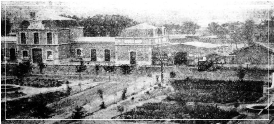
1907年正太铁路太原站

孙中山要来太原了。 人们奔走相告，从火车站到现在的五一广场，涌满了人，正太路上张灯结彩，学生手执彩旗喊口号，乐队使劲奏乐，热情一浪高过一浪，一直持续到孙中山走下专列，脱帽向群众致意。几声欢迎的礼炮响过，群众高呼声不断，这样的热烈持续了很长时间，一直到孙中山入了城，下榻在皇华馆都没有停歇。 孙中山是来考察正太铁路及山西矿产情况的，那天是1912年9月18日。与官方人士会谈，在山西大学堂演讲，会见同盟会、军界、实业界及各党派人士，忙碌了三天，21日他离开了太原，送行的人群更多，纷纷挤到火车站和他道别。 太原近代史上，孙中山这一次来是大事，为太原工商业发展奠定了基础，而他到来和离开的火车站也定格在历史里。 之前的太原，作为辛亥革命的呼应，也响起了起义的枪声，很快太原光复，孙中山还给了太原起义很高的评价：“使非山西起义，断绝南北交通，天下事未可知也。” 之前的清光绪三十年（1904），光绪批准了建设正太铁路，1907年正太线正式通车，这时的太原车站，人们称为太原府站，因为太原是清王朝的府城。 孙中山来时，太原府站是巴洛克式建筑，与石家庄火车站一模一样的奇怪建筑，我们无法说清楚它的形状，如果你知道这条铁路是由法国工程师越黎勘探，法国总工程师埃土巴尼主持施工，后由法国经营，一直到1933年才移交民国政府，就不会奇怪了。 在17世纪的法国，英国人休·昂纳在《中国风》中写道，当时兴起了巴洛克式中国风，他们把东方和欧洲元素结合起来，形成他们的世界，包括商品，也包括建筑，这股风一直持续到18世纪，他们意识里的东方，是那样富丽堂皇，所以建筑上要打破平衡，追求意外。平面图上看是椭圆形、橄榄形或复杂的几何图形的建筑，或许满足了他们的心理期待，可在今天的我看来，却是一个怪建筑。 孙中山看到的火车站，并不是现在的火车