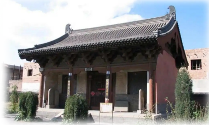
阳曲县不二寺(资料图)

阳曲县,史称“三晋首邑”,地处忻州与晋中盆地之脊梁地带,扼晋要冲,太原门户,东西北三面环山,为兵家必争之地。