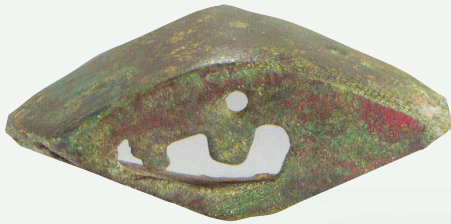
陶寺铜铃是迄今所知年代最早的完整复合铜器,可以判定这时礼乐制度已初步形成。

中华文明早期形态,什么样? 开馆!陶寺遗址博物馆11月12日向公众开放,展出的230件(套)文物,涵盖陶寺文化所有的文物类别,首次系统呈现约4000年前的陶寺文明。