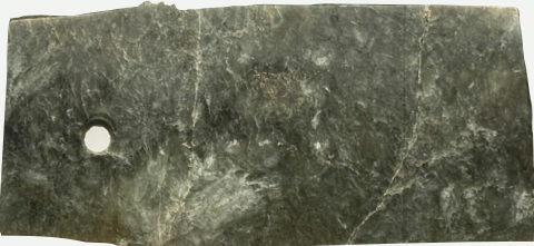
山西史前时期第一件牙璋闪亮登场