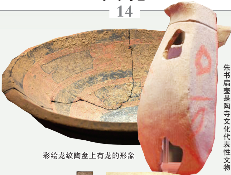
彩绘龙纹陶盘上有龙的形象

除了前三种外,还有文化遗产作为第四种证据。如今陶寺附近有尧庙、尧陵、尧居,还有很多与尧有关的神话。所以我们可以看到,它有着一系列证据,相比而言,这里比其他任何一个地方更接近历史的真实。 据《三联生活周刊》 张星云