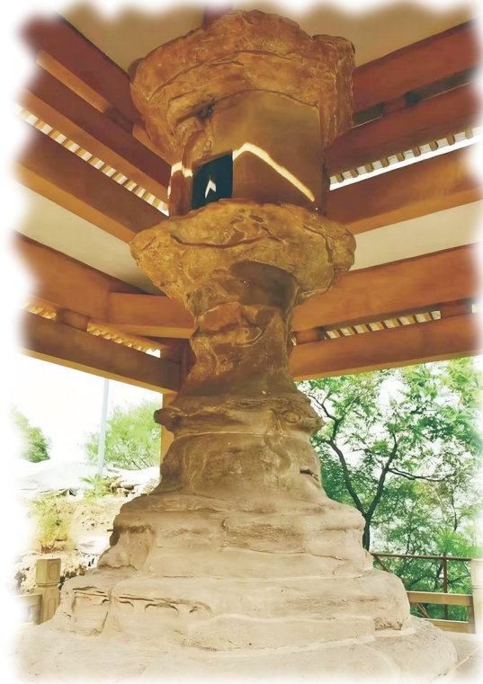
龙山童子寺燃灯石塔(资料图)

在太原西山,一座石塔静静耸立,望着山下的平原与河川,一望就是1400多年。它便是著名的龙山童子寺燃灯石塔。