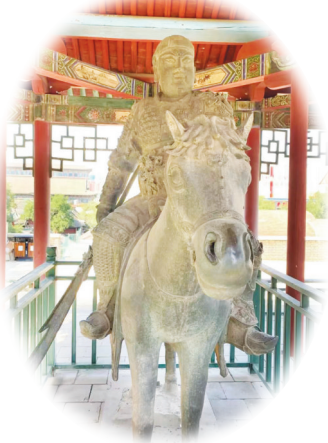
纯阳宫关羽铜像(资料图)

五台山是四大佛教名山之首，位于太原的北部。佛国五台，相传是文殊菩萨的演教道场，文殊寺也因五台山而闻名。明代时期太原文殊寺是朝圣五台山的“驿站”，也是僧人进入圣地的必经之路。各地文化在这里碰撞并交融，使得太原不仅展现了文化的吸纳力与包容性，更彰显了人文意义的深远与从容。锦绣太原的文脉，就如同天王殿旁那棵枝繁叶茂的古槐树，源远流长，生生不息。