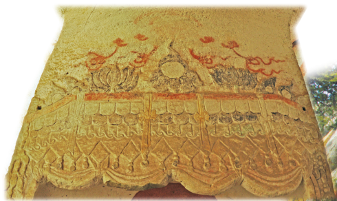
第8窟中心塔柱背面龕楣