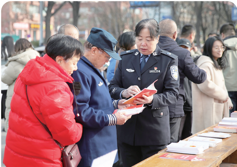
12月4日,迎泽司法所工作人员走上街头开展“12·4”国家宪法日宣传活动,通过发放宣传资料,提供法律咨询等形式,提升居民法治意识。

“小区里有很多在矿上上班的工人,夜班回家的路上再也不用摸黑了。而且,随着冬天天气变短,孩子们上下学也变得更加安全。”社区居民张大姐对这次更换楼道灯的行动赞不绝口。 ■ 新时代文明实践 ■