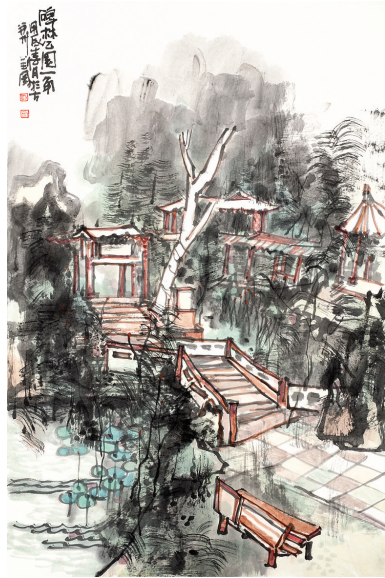
石林公园一角（写生）刘刚绘