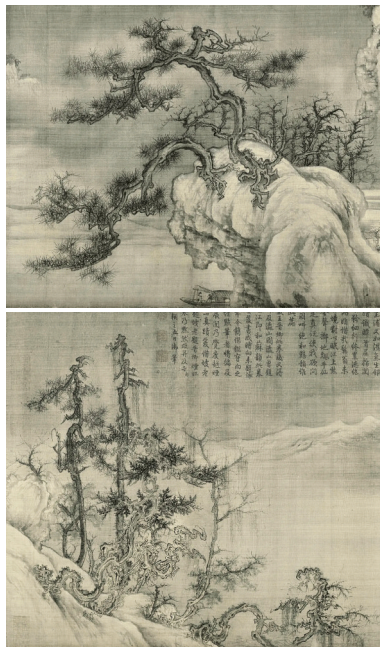
《渔村小雪图》（局部）宋·王诜 绢本设色 纵44.5厘米 横219厘米 故宫博物院藏

值得一提的是，该卷与水墨本《烟江叠嶂图》（上海博物馆藏）在图式、笔墨、母题上有很多的相似之处，尤其是两张画卷的最末一段的结构布置几乎一模一样。所不同的是《渔村小雪图》笔精墨妙，结构紧凑，堪称珍品。