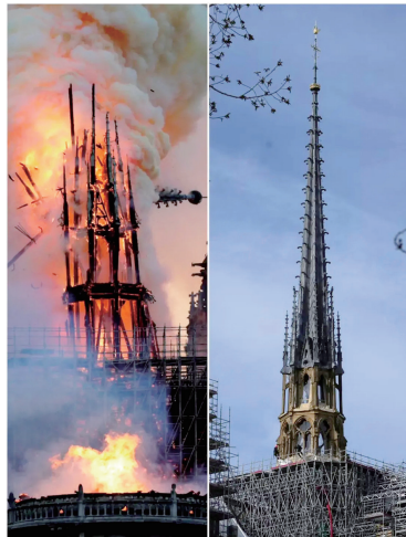
九十六米的尖塔修复后复刻了十九世纪的设计