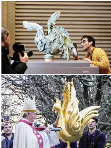
尖塔顶部新的镀金公鸡像宛如涅槃的『凤凰』

自2019年4月遭火灾严重损坏后,巴黎圣母院历经5年修复,目前主体重建工作已完成,从12月8日起重新对公众开放。这5年都修复了什么? 圣母院会收费吗? 修复工作对世界文化遗产保护有何借鉴意义?