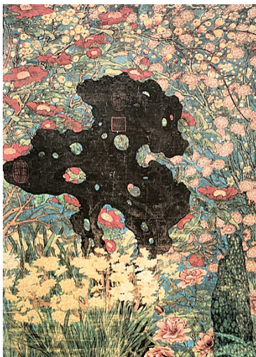
《岁朝图》(局部) 宋·赵昌 绢本设色 纵103.8厘米 横51.2厘米 台北故宫博物院藏

在构图上，画家也是别出心裁。他运用繁密交错的花朵和湖石，布满整个画面，丝毫不留空地，使得画面布局盈满，极具装饰效果。赵昌善于把握花鸟的精神特质，以细腻的笔触和生动的形态，将花卉的娇艳和生机展现得淋漓尽致。他还巧妙地运用色彩对比和层次变化，使得画面更加立体和生动。