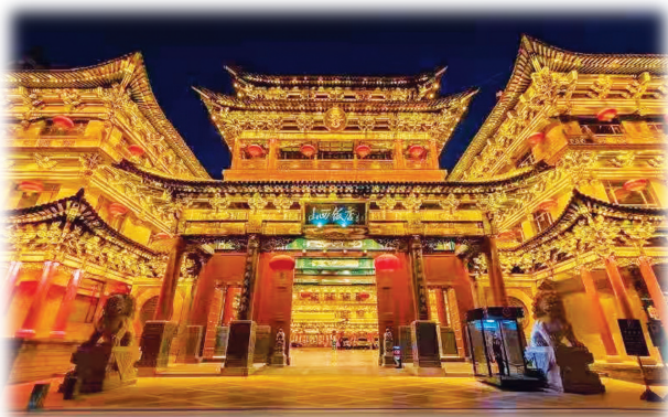
山西饭店夜景(资料图)