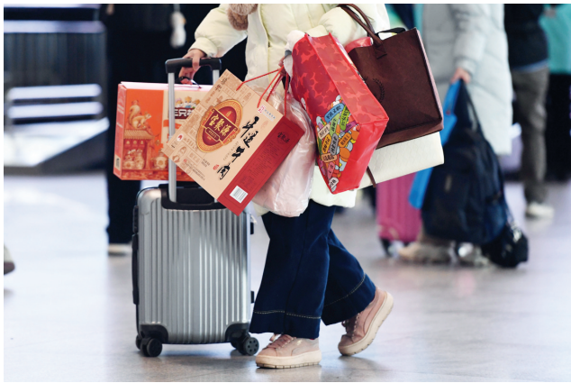
旅客们带着山西土特产