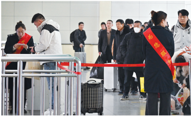
乘客有序检票乘车