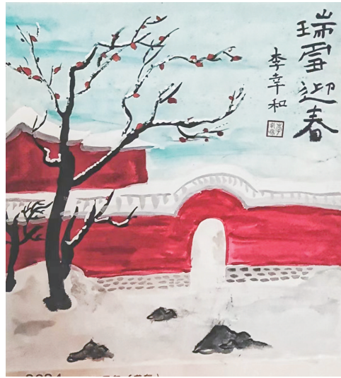
瑞雪迎春 李幸和 作

时光的痕迹爬上了父亲的额头,匆匆的飞雪花白了父亲的鬓发,但父爱,却永远陪我,自伊始,至永恒。