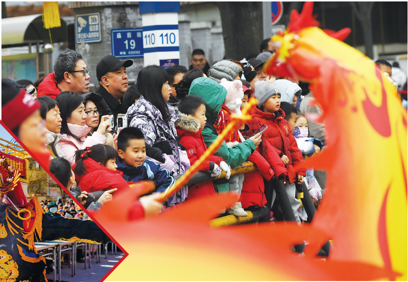
观民俗(关帝庙博物馆)