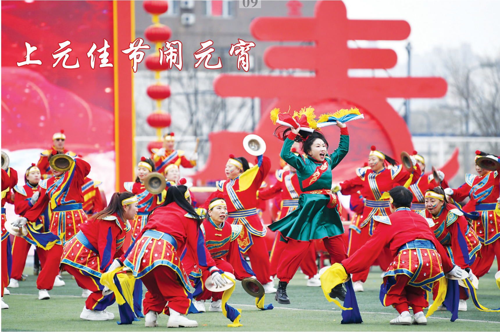
敲锣鼓(万柏林体育场)

还沉浸在春节的祥和里,又迎来元宵节的欢乐。赏花灯、吃元宵、猜灯谜、闹社火,我市多地举行了各具特色的庆祝活动,迎元宵、庆团圆。