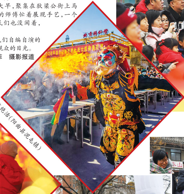
耍绝活(阳曲县泥屯镇)