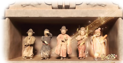
山西博物院的金代五戏俑亮相“春戏晚”(资料图)

“春戏晚”以太原为舞台，以戏曲为纽带，通过“戏曲+”的模式和名家名角的精彩演绎，讲好中国故事、传播好中国声音，让全球观众感受到中华优秀传统文化的强大魅力，让戏曲艺术在中华民族现代文明的建设中持续闪耀光芒，为实现中华民族的伟大复兴提供了强大的精神动力。