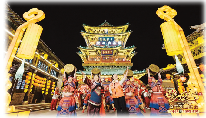
全民戏曲嘉年华《百戏芳华》(资料图)

梨园焕锦绣，龙城映春晖。蛇年春节期间，中央广播电视总台《2025年春节戏曲晚会》在太原古城华丽呈现。晚会以“过大年、看大戏”为轴心，为广大观众奉上了一场汇聚全国近80家文艺团体、30多个不同地区戏曲剧种和演员，“戏曲+民俗、科技、景观”的文化盛宴，传承和弘扬中华民族传统节日和戏曲文化，营造了浓厚的节日氛围。