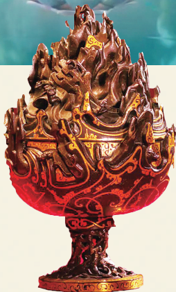
河北博物院藏 错金铜博山炉

作为全片最重要的法宝之一,七色宝莲有着强大功效,有了它,哪吒和敖丙才能“重塑肉身”,它与博山炉形如山峦的造型极为相似。博山炉是古代的“香薰机”,因外形酷似仙山而得名。2000年前,汉代的无名工匠们将山的神秘借以3D思维表达,奇幻的场景被定格在一只香炉上,穿越千年和我们遇见。