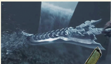
彩蛋四： 敖光的武器

被无量仙翁称作“阐教根基”的天元鼎,是玉虚宫里炼丹的重要法器,原来最开始出现的形态只是“冰山一角”,最终呈现的视觉效果极为震撼。无论是以哪种形态出现的大鼎,都极具商代青铜鼎的特色,而大鼎上的弧形纹饰则是饕餮纹。大鼎整体呈现出的浑圆造型,和古代名叫“敦”的青铜器如出一辙。