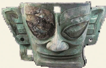
三星堆博物馆藏 青铜大面具

从《哪吒1》到《哪吒2》,这两个结界兽大家一定印象深刻。它们不仅是守护结界的神兽,还是滑稽可爱的“搞笑担当”。如果你去过三星堆博物馆,就会发现——实在是太眼熟了!粗眉结界兽有着夸张的大粗眉和蒜头鼻,这些特征与戴金面罩青铜人头像以及青铜大面具的经典元素高度契合。