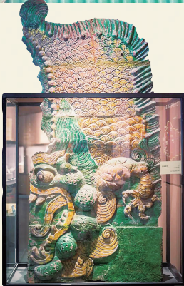
大同市博物馆藏 琉璃鸂吻

阐教仙门重地玉虚宫的外景一出,引得观众直呼“好美”。它的色彩与布局,是对宋徽宗名画《瑞鹤图》的致敬。屋脊两侧的鸂吻是古建筑上的典型装饰。而中国最大的琉璃鸂吻就在山西大同华严寺大雄宝殿殿顶,鸂吻高4.5米,历经900年风雨,至今璀璨夺目,只不过电影中增加了青铜元素。