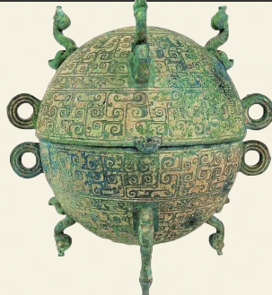
湖北省博物馆藏 嵌地几何云纹铜敦

被无量仙翁称作“阐教根基”的天元鼎,是玉虚宫里炼丹的重要法器,原来最开始出现的形态只是“冰山一角”,最终呈现的视觉效果极为震撼。无论是以哪种形态出现的大鼎,都极具商代青铜鼎的特色,而大鼎上的弧形纹饰则是饕餮纹。大鼎整体呈现出的浑圆造型,和古代名叫“敦”的青铜器如出一辙。