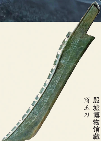
殷墟博物馆藏 商玉刀

敖光一出场便吸睛无数,他的大刀也同样吸睛。此刀名为“龙牙刀”,其设计融合了两种不同的武器元素。前半部分参考了商朝时期的青铜刀,刀尖上挑、刀背附齿、刀腹略收,正是商朝青铜刀的典型特征。后半部分则采用龙吞口,这种造型在关刀上最为常见,从唐代盛行直至明代。