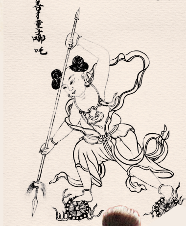
清代墨绘本《封神真形图》

明清时期《西游记》《封神演义》等神魔小说的流行使得手持火尖枪、脚踩风火轮的叛逆哪吒形象深入人心。《封神真形图》中,哪吒穿上了肚兜,成为一位“幼稚”童子。据《新京报》