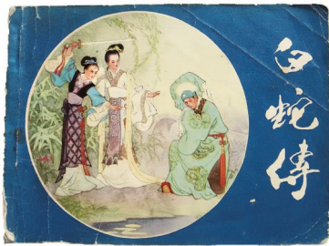
1981年出版的《白蛇传》连环画

今年是乙巳蛇年,蛇常给人以矫捷灵敏的印象。在中国悠久的传统文化里,蛇是智慧与神秘的象征,蕴含着丰富的文化意蕴和美好寄托。蛇年说蛇,我收藏了一本旧版的《白蛇传》连环画,每每翻阅,都赞叹连连,回味无穷。