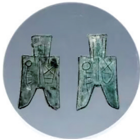
“晋阳”尖足布(山西博物院藏)

白云寺不仅以其悠久的历史、宏伟的建筑和清幽的环境吸引着八方来客,更因诸如老僧常八十这样的传奇故事而增添了无尽的文化魅力。白云寺,这座承载着丰富历史与文化底蕴的佛家圣地,将继续以其独有的方式,诉说着过去与现在的故事,吸引着更多人去探寻、去感悟。