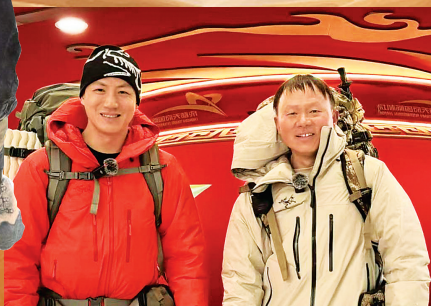
两人徒步前后的对比