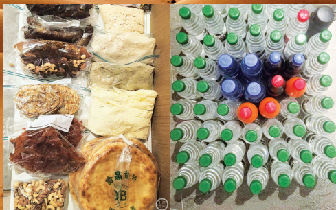
两人携带的生活必需品