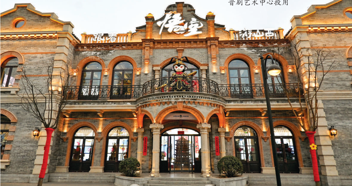
游戏《黑神话：悟空》引发我市旅游市场热