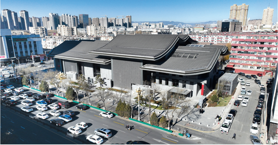
晋剧艺术中心投用