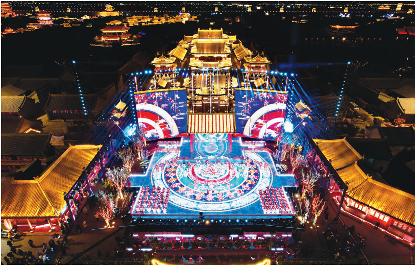
中央广播电视总台《2025年春节戏曲晚会》在我市录制