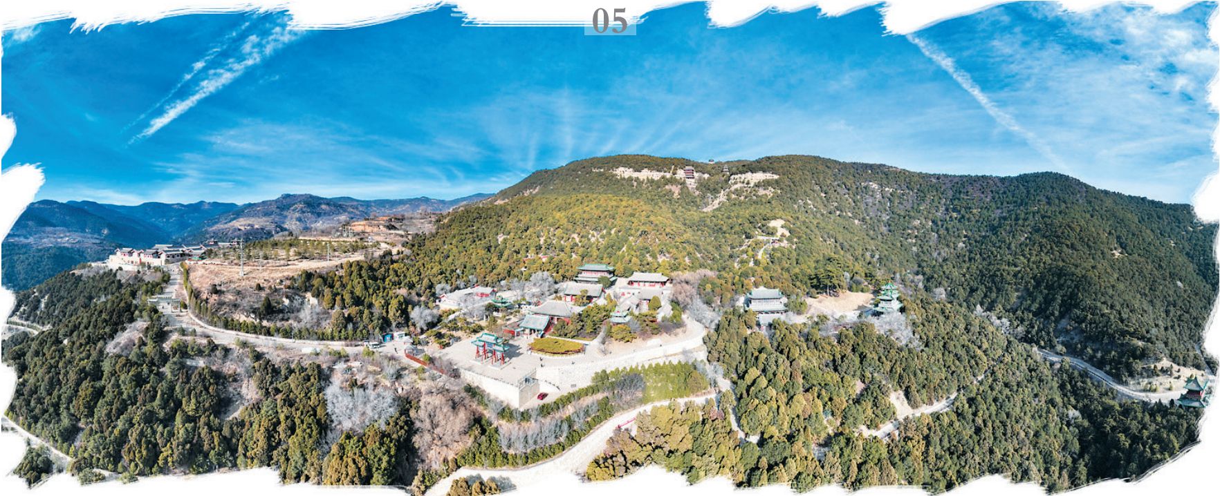
晋祠天龙山景区正式被确定为国家5A级旅游景区