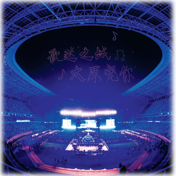
32场演唱会贯穿全年