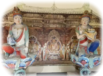
3D打印复制的佛光寺彩塑供养菩萨像(资料图)

“盛唐遗韵”展，绝非仅仅是一场文物陈列展示，更是一次对历史文化的深度溯源。透过这些展品，我们真切领略到盛唐的辉煌成就，深刻感受到这座城市深厚的历史底蕴与文化魅力。它时刻提醒着我们，太原作为历史文化名城，凝聚着无数先辈的智慧与心血，是中华民族文化宝库中一颗璀璨夺目的明珠。在新时代，我们更应传承和弘扬太原的历史文化，让盛唐遗韵在这片古老的土地上继续闪耀光芒，续写辉煌篇章。