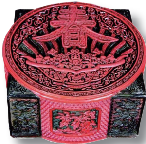
清乾隆御制剔彩春字天圆地方琮式盒

笔者在拍场看到过一件清乾隆御制剔彩春字天圆地方琮式盒，印象很深。由于国力强盛和乾隆帝的积极推动，清代漆器制作达到鼎盛。乾隆三十六年(1771)至四十年(1775)左右，宫廷密集制作了各式雕漆宝盒，百工炫巧争奇，料不厌精，工不厌细，开创出华丽精巧的典型风格，影响深远。而剔彩则属雕漆中工艺最为繁复的一类，较为少见。