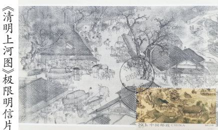
《清明上河图》极限明信片

如今重抚这些邮品，墨色里的汴河仍在流淌。它们不仅是集邮册中的珍藏，更是文化基因的活态传承。