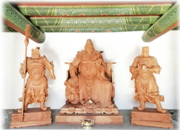
正殿一楼关公与周仓、关平的木制雕像

说起南肖墙关帝庙，首先特别叹服太原市丰厚的地名文化，这是活态的历史记忆符号。比如南华门和南肖墙就与明代晋王有关。话说晋王朱橚于明洪武十一年(1378)来到太原，即在今精营街一带修筑王府宫城。宫城是一座方形土城，辟四门，东边的门叫东华门，西为西华门，南为南华门、北为后宰门。