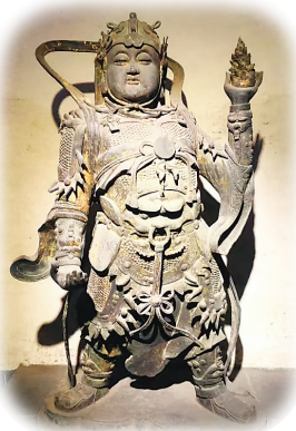
纯阳宫韦陀像(资料图)

从将军形象来分析，盔甲最早出现于商周时期，起初是用兽皮、藤绳串结而成，用于护身。