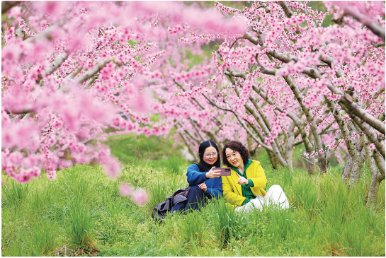
▲4月1日，游客在重庆市黔江区濯水镇乌杨社区黄桃基地赏花游玩。