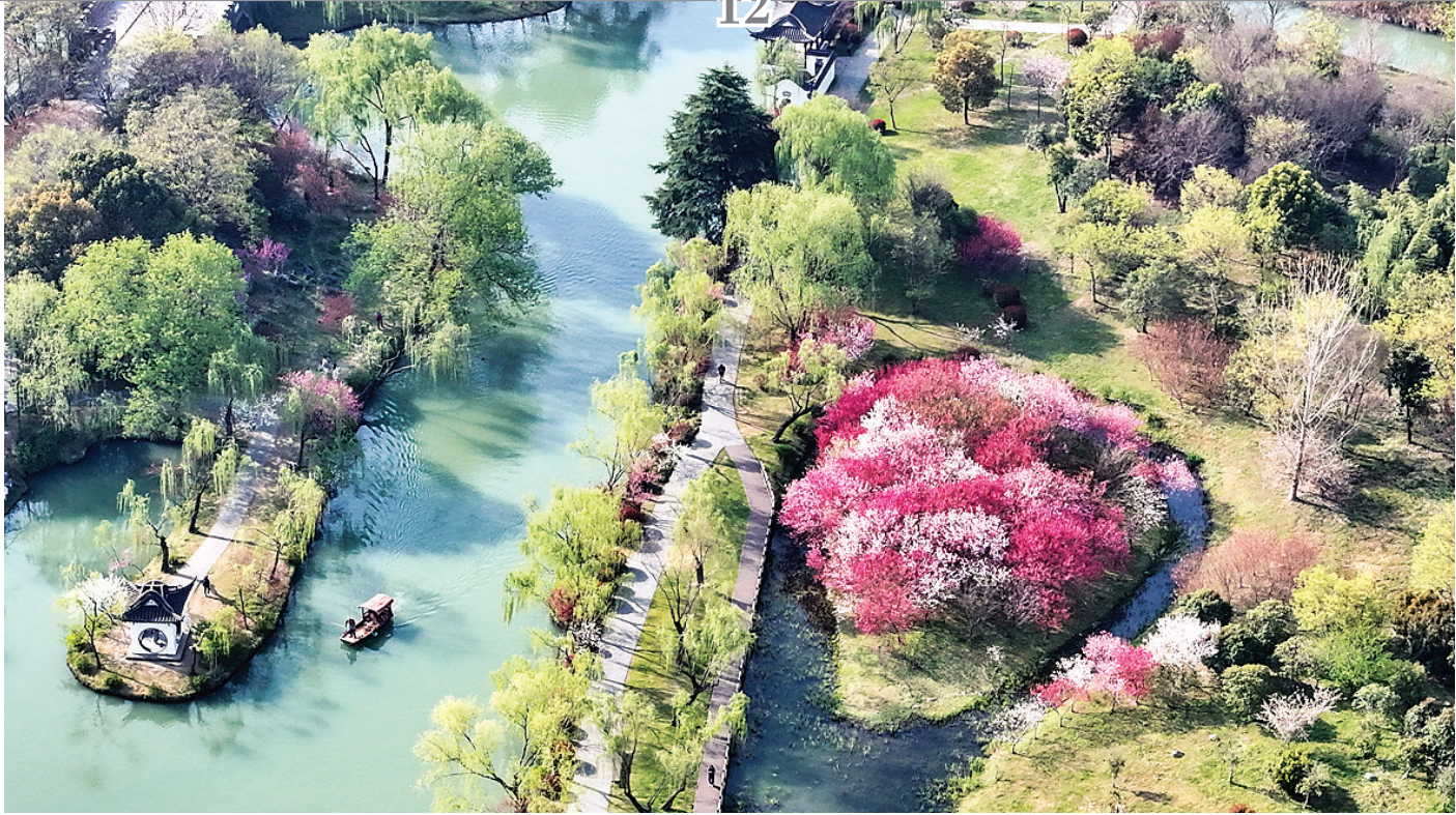
◀4月2日，游人在江苏扬州瘦西湖风景区踏春赏景(无人机照片)。