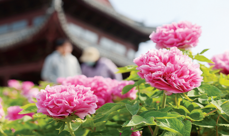
◀4月1日，在河南省驻马店市汝南县天中山文化园，游客在欣赏盛开的牡丹。