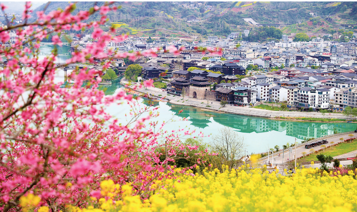
◀3月31日，游客乘坐小火车游览重庆市黔江区濯水古镇。