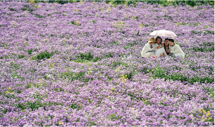
◀4月2日，市民在安徽省合肥市肥西县派园花海游玩。