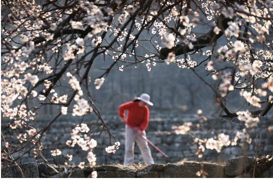
▲3月31日，在山东省淄博市沂源县悦庄镇前坡村，农民在杏花盛开的田间整理土地。