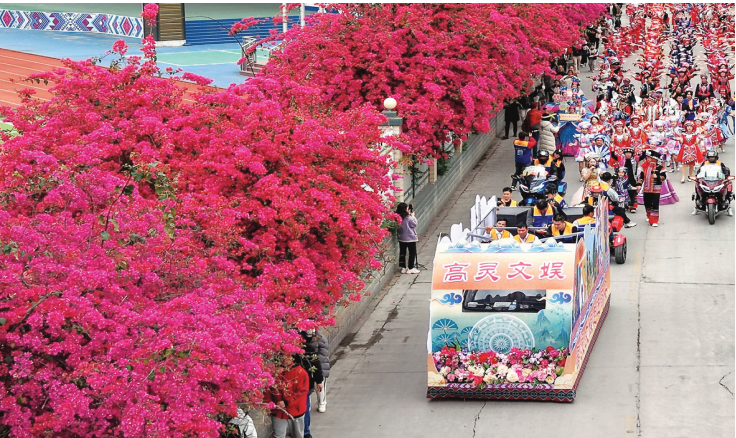
◀3月31日，广西都安瑶族自治县“三月三”庆典活动中，民俗文化巡游队伍行走在花团锦簇的街道上。