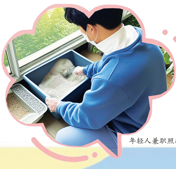
年轻人兼职照顾猫