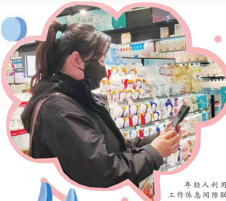
年轻人利用 工作间隙联系 父母