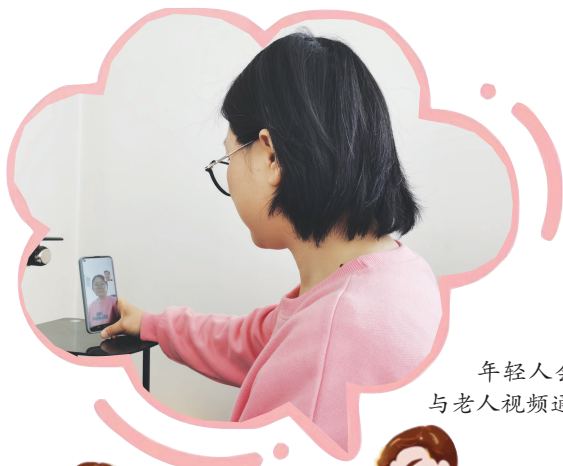
年轻人会议后 与老人视频通话