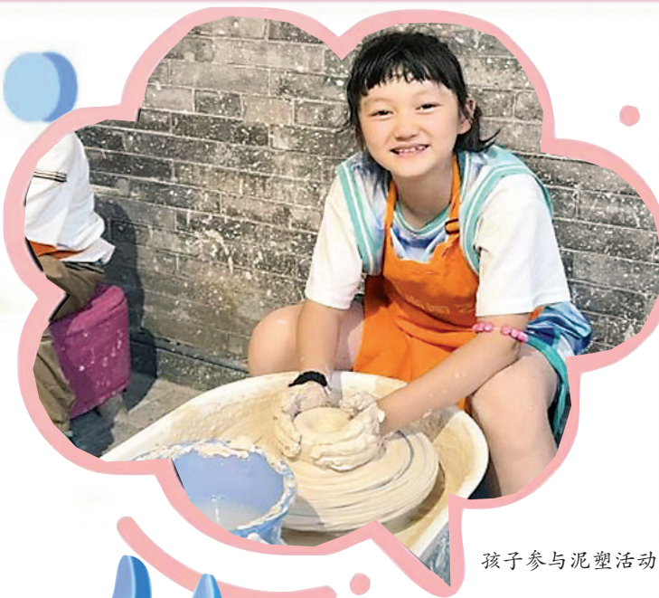
孩子参与泥塑活动