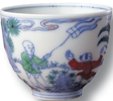
斗彩婴戏图杯(故宫博物院藏)

“紫燕嬉戏柳枝头，纸鸢飞舞方寸间。”在这春暖花开时节，品赏这件斗彩婴戏图杯，在春天里，放飞一只纸鸢，放飞一份心情、一缕希望、一种理想。看纸鸢高飞，任春风拂面，寻常日子，就这样明媚。