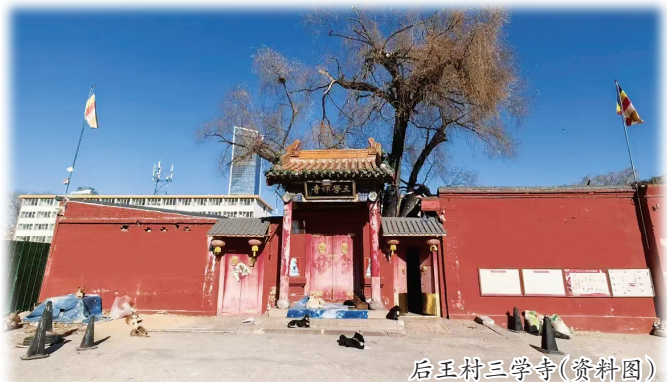
后王村三学寺(资料图)

大雄宝殿内，三尊金身佛像慈目低垂俯瞰着众生，莲花座下祥云缭绕。佛前长明灯的火苗轻轻摇曳，西塑像是药师佛，东塑像是阿弥陀佛，中间塑像是释迦牟尼佛。