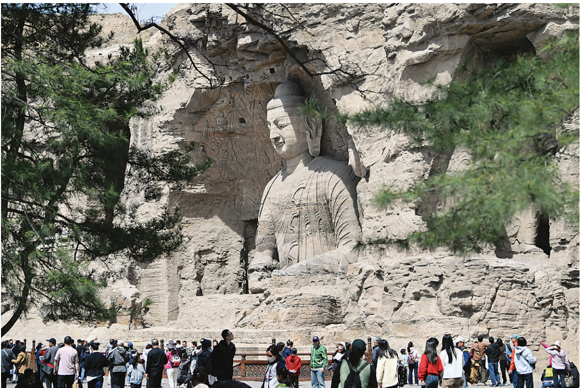
4月16日,游客在云冈石窟游览。

位于山西大同的云冈石窟,距今已有1500多年历史。千百年来,云冈石窟见证了中外文化、中国少数民族文化和中原文化、佛教艺术与石刻艺术的一次次握手,堪称一部刻在石头上的史书。