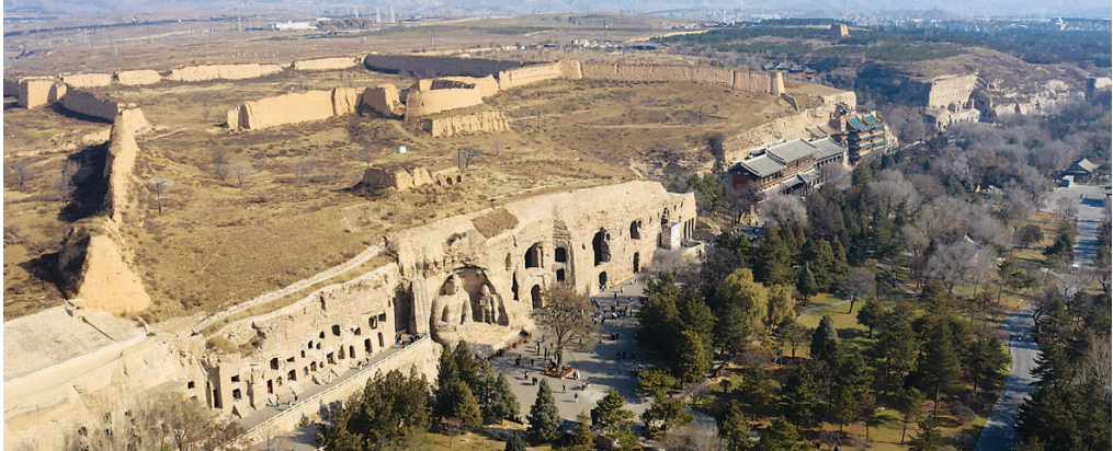
这是2024年11月7日拍摄的云冈石窟全景(无人机照片)。