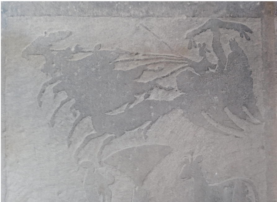
纯阳宫藏左元异汉画像石之驷马豪车飞奔图(资料图)