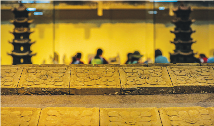
山西晋韵砖雕艺术博物馆里的砖雕作品