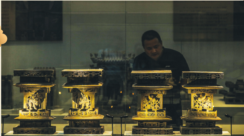
山西晋韵砖雕艺术博物馆里的埴头