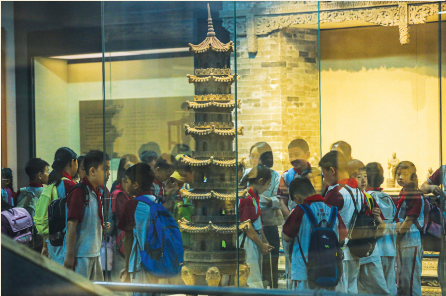
山西晋韵砖雕艺术博物馆里研学的学生