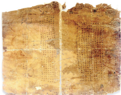
帛书第一卷《四时令》

尚未回归的子弹库帛书第一卷“四时令”,相对完整,写在一件长47厘米、宽38.7厘米的丝绸上。分甲、乙、丙三篇,