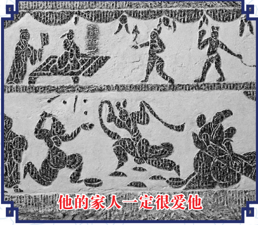
他的家人一定很爱他

1956年,考古人员在湖北鄂州两座相隔十余米的宋墓中分别发现了半面菱花形铜镜,大家试着把它们拼在一起,发现断面吻合连接自然,可以拼出一面完整的人物故事镜。这面千年后重圆的铜镜,给大家留下了浪漫的想象空间。