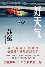
《好天气》 苏童 著 江苏凤凰文艺出版社

小说围绕咸水塘区域城郊接合部两边的发展变迁展开,写南方不为人知的土地在时代发展中的爱恨悲欢。一边是农村,一边是城市,以池塘为界的城乡两个家庭,两个家庭的同名女主人,几个同龄孩子产生羁绊,几十年风雨恩怨,随着咸水塘的彩色天空消失而烟消云散。