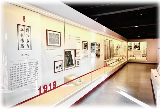
直把并州作故乡——回望柯璜先生特展（资料图）

通过看展览，我对柯璜先生有了更深的认识。除了文博领域，他在教育、书画方面同样成就斐然。在展览的结尾，策展人写道：“一个文化名人，就是一座城市的丰碑。”诚如是。先贤烛照，对于我们后辈，该如何吸收弘扬？策展人又说道：“他的正气、才气、灵气、和气，他的道德、学问、为人、意志、信仰令我们敬佩和景仰。睹物思人，仅以此展激励后辈，向先生致敬！”致敬二字，余音绕梁，不绝于耳。