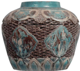
珐华开光镂空罐（太原市博物馆藏）

珐华器又称为珐花器，被誉为“山西三宝”之一。太原市博物馆馆藏一件珍贵的明代珐华器：珐华开光镂空罐，见证着山西源远流长的珐华制瓷史和明代高超的制瓷技艺。