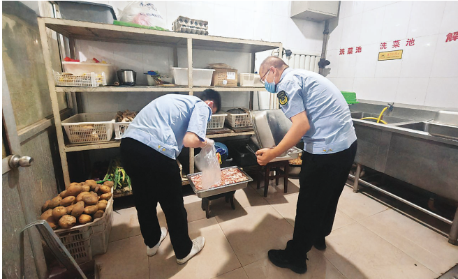
工作人员现场抽样

立即返回实验室快速检测,确保第一时间出具结果,为食品安全提供技术支撑。同时,工作人员积极向食品经营户宣传食品安全知识,引导其规范经营行为,共同为考生营造安全、健康的食品消费环境。截至目前,本次专项快检共完成食品抽检152批次,其中蔬菜类125批次、肉类27批次,检测结符合快检标准。