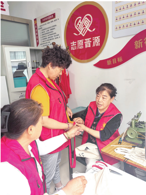
队员们在探讨衣服修改方案