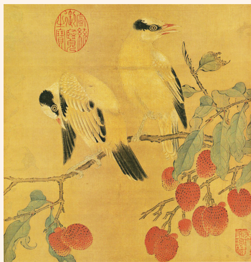
《离支伯赵图》 台北故宫博物院

当你剥开一颗荔枝时,别忘了——你正在品尝的,可是穿越千年的文化滋味!所谓“一骑红尘妃子笑,无人知是荔枝来。”荔枝,如何从昔日的御用贡品成如今的寻常果品?诗与画中的荔枝,到底有着怎样的风雅?