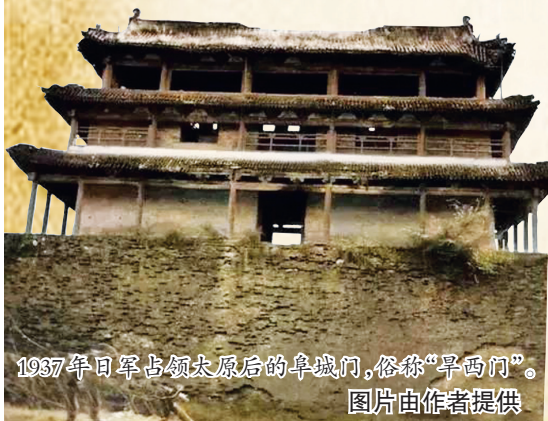
1937年日军占领太原后的阜城门,俗称“早西门”。

宋太宗诏毁晋阳城后,于982年在唐明监的河东军旧城基础上建起了并州城,即今天太原老城区。