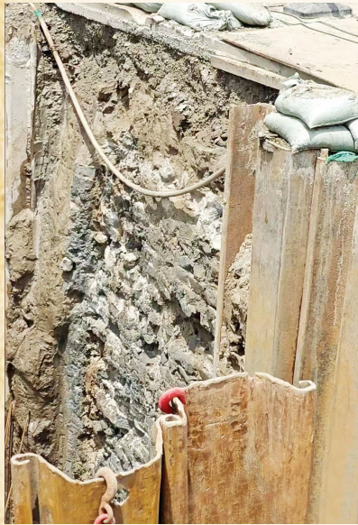
施工现场发现古城墙遗址。

太原古城是一座有着千余年历史的文化名城。它从唐代始建,北宋重建,明代拓展,又历遭战争劫火,屡经废兴。特别是在今天的城市现代化建设中,太原街头高楼林立,街景靓丽,古城遗址哪里还有踪影?不过,如果我们仔细追寻,仍旧可以在残存的遗迹和古地名中探索到太原古城千年的沧桑。