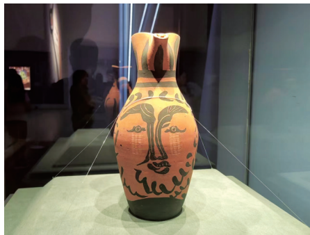
严巴布(陶瓷) 巴勃罗·毕加索 作