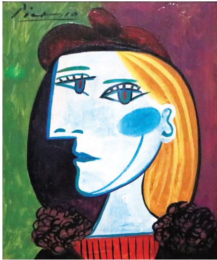
蓝眼睛的女人(油画) 巴勃罗·毕加索 作