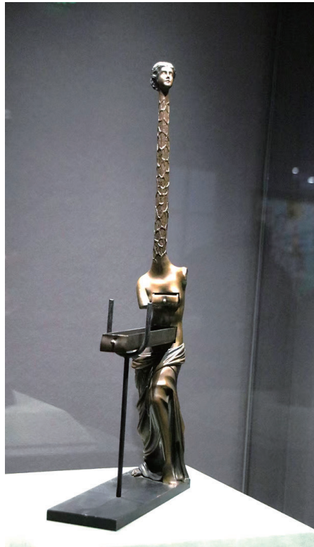
长颈鹿的维纳斯(雕塑) 萨尔瓦多·达利 作