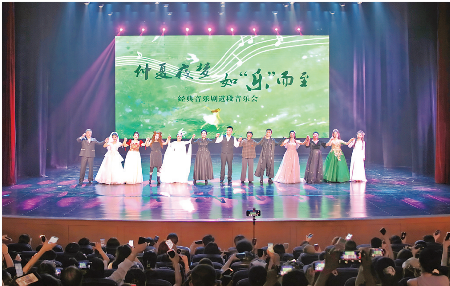
6月24日晚,山西艺术职业学院举办“仲夏夜梦如‘乐’而至”经典音乐剧选段音乐会。