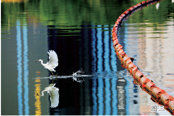
图一：原片 图二：裁片 图三：原片 图四：裁片

数码相机时代，完成前期拍摄后，后期处理环节往往需要在电脑或手机屏上对作品进行审视。利用修图软件剪裁画面，也即“裁片”，业内专业人士称之为“二次创作”。虽然，这是作为摄影成片不可或缺的一个重要环节，但也有些摄影者不甚理解。他们认为，裁片涉及的只是画幅(量)的大小与形状，并不能导致内容(质)以及主体的改变，“二次创作”也就无从谈起。这是摄影认识上的一个误区，其实，“量变引起质变”也体现于此。因为裁片所运用的内容取舍、画面优化、主题集中，以及剔除冗余元素，在事实上，已经发生了新的审美指向，这就是“二次创作”的命义所在。