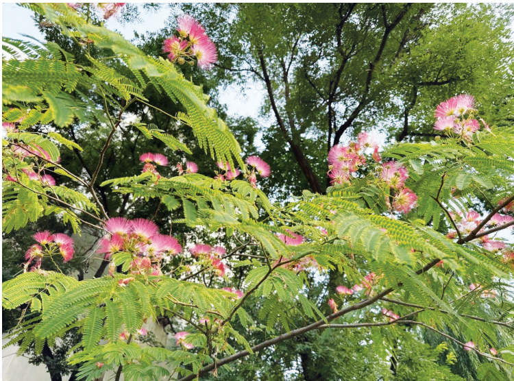
饮马河公园,合欢树撑起绯红浪漫

本报讯(记者 刘晓亮 文/摄)7月的风拂过太原,迎泽公园、饮马河公园、双塔公园等处的合欢树悄悄绽开羽状绒花,万千粉霞般的“爱情树”迎来一年中最绚烂的时节。 据了解,合欢树是豆科合欢属的一种落叶乔木,其花形独特,由无数细长花丝聚合而成,色泽娇嫩,白天舒展、夜晚闭合,因此也称之为“夜合花”,象征着家庭和睦、夫妻恩爱、百年好合,有着“爱情树”的美称。 当下,正是合欢树花开绚烂的时候。饮马河公园的合欢树位于湖心岛附近,树冠茂密如云,树下还有便民座椅,方便游客在美景中、阴凉下放松休憩。黄昏时分,常有游客在民乐台前唱歌跳舞,盛放的合欢花为之增添了一抹绯红的温柔;迎泽公园、双塔公园、和平公园的合欢树分布园区各处,粉色的花朵如轻盈的羽扇,又如无数撑开的绒毛小伞,挨挨挤挤、层层叠叠,在碧叶映衬下,织就了一片如梦似幻的粉