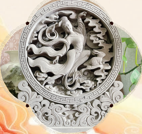
“嫦娥奔月”砖雕作品

地域差异更让砖雕风情万种。“晋北砖雕如塞北长风般粗犷豪放，晋中、晋南砖雕则似汾河流水般细腻讲究。南方水秀山明，砖雕与白墙灰瓦相映，花形寓意点到为止。北方少花少木，花瓣雕刻层层叠叠，造型精致。”韩永胜介绍，窑前雕（泥坯雕刻后烧制）与窑后雕（烧砖后雕刻）的分野，更藏着工艺的智慧——窑后雕所用青砖烧制温度更高，更耐岁月侵蚀。“只要不人为破坏，能存上千年”。