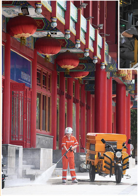
环卫工人在烈日下忙碌