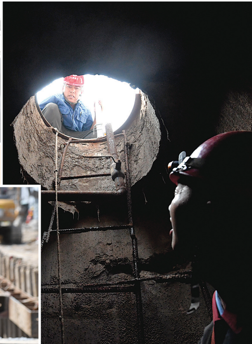
热力检修工蜷缩在狭小的管道间