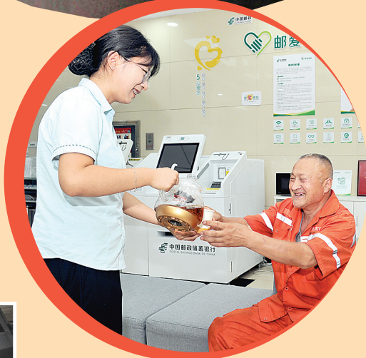
邮政爱心驿站为环卫工人“送清凉”