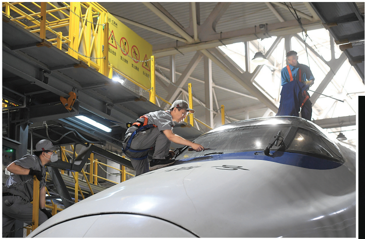
检修动车的动车运用所工人