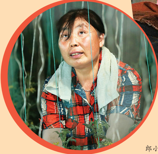
大棚内，农户 专注于手头的工作

近日，我市持续高温天气。7月15日，38℃；16日34℃，不少人直呼：太热了。而对户外工作者来说，面临的“烤”验要远超普通人。 在新建路改造工地上，市政工人们正在进行钢筋绑扎作业。虽然烈日将金属构件晒得发烫，安全帽下的脸庞上布满汗珠，但他们仍一丝不苟地完成着每道工序。