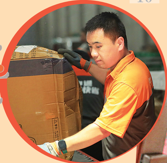
分拣货物的快递员