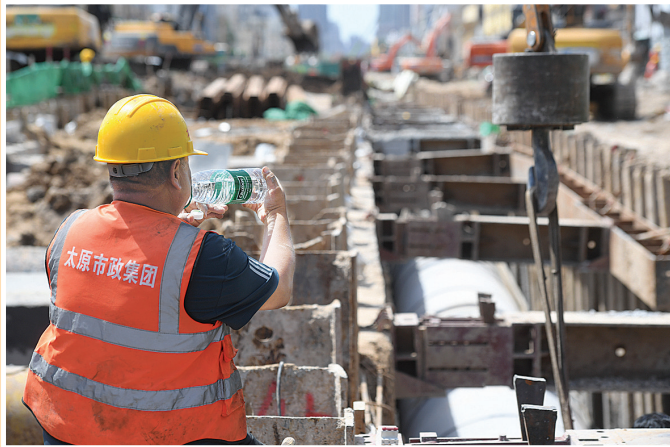
新建路改造工地上，市政工人在工作间隙喝水