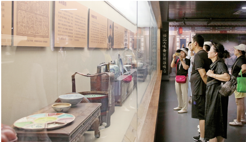
烈日炎炎,许多游客选择走进博物馆,纳凉的同时感受太原历史文化。图为7月20日,游客在清徐县六味斋工业园区的云梦塢景区博物馆参观。

活动现场,社区还为每位环卫工人准备了防暑降温礼包,内含藿香正气滴丸、防晒袖套、酸梅汤等实用物品,受到环卫工人们欢迎。